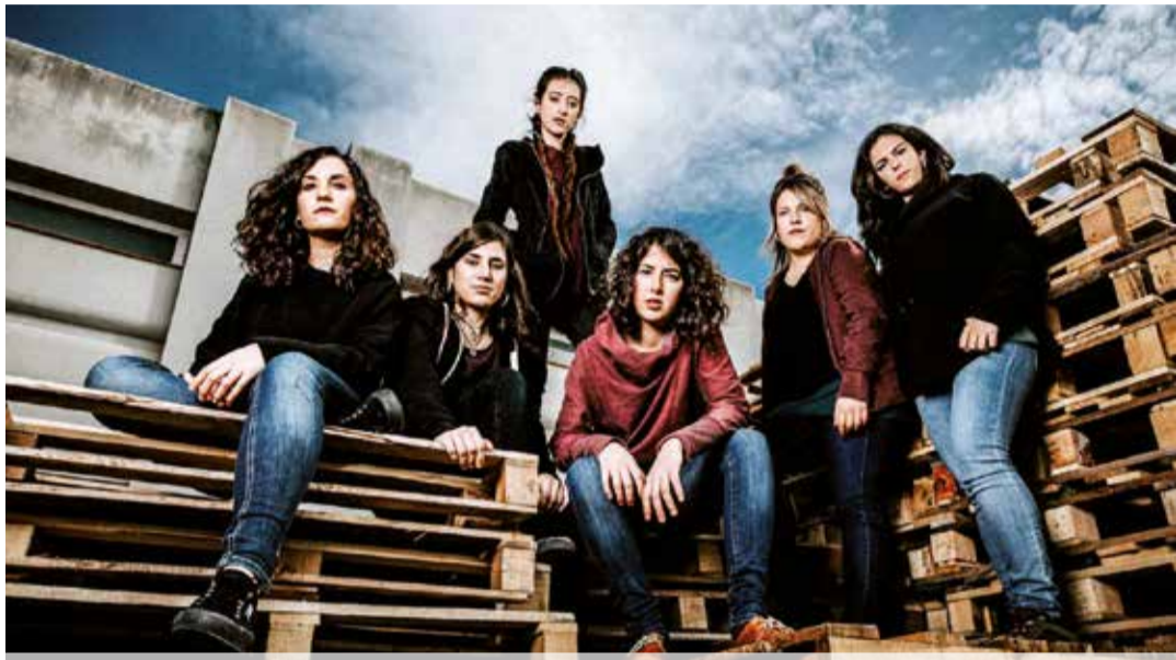
El grup Roba Estesa oferirà un concert a la Plaça de les Acàcies, el proper 28 de novembre, a les 20:30 hores.

Universitats, associacions i entitats han creat bases de dades digitals on consultar el nom, la història i el contacte de dones especialistes en ciència, literatura, tecnologia i música, entre altres àmbits.