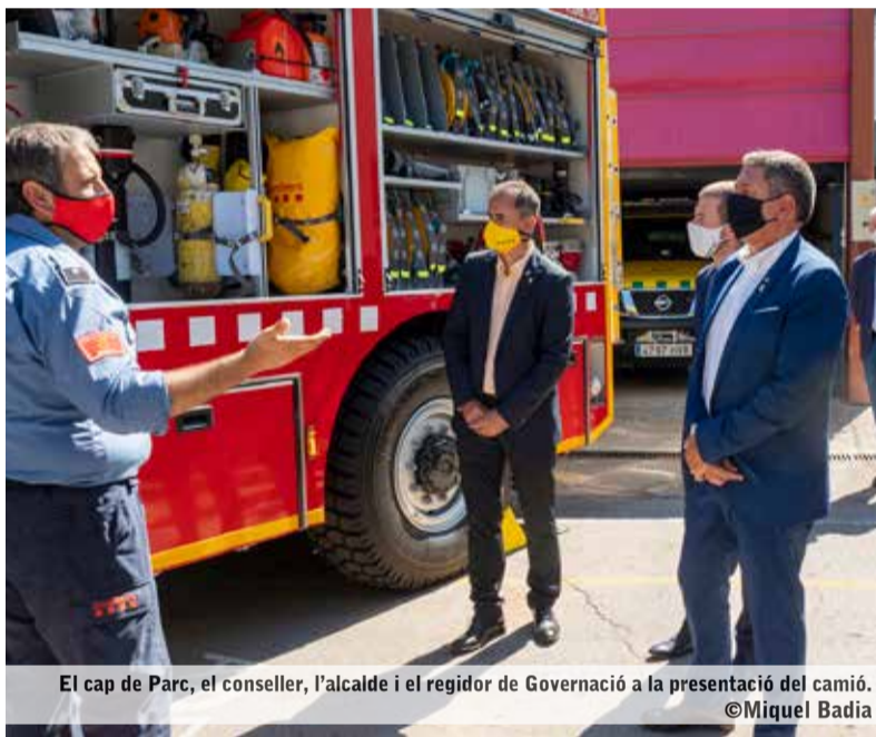
El cap de Parc, el conseller, l'alcalde i el regidor de Governació a la presentació del camió.