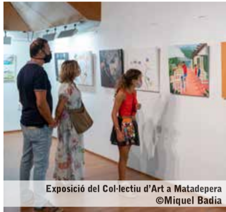
Exposició del Col·lectiu d'Art a Matadepera ©Miquel Badia

Per tal de complementar la nova exposició col·lectiva que va inaugurar, el 19 de setembre passat, el Col·lectiu d'Art de Matadepera, va organitzar un acte, en el qual estaven convidats a participar els autors i autores de les obres i on cadascun d'ells explicava la seva obra, el procés creatiu que havia seguit, la motivació o els sentiments que l'havien dut a realitzar-la. La proposta també preveia que el públic assistent pogués conversar amb els diversos autors/es, fer-los preguntes i opinar sobre les obres. Es tracta d'una proposta pensada per intercanviar visions sobre "la incorporació de les lletres a l'art", que ha estat l'eix de creació de l'exposició que es pot veure a la sala d'actes del Casal de Cultura.